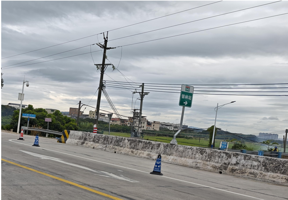
图 1 高速公路指引标牌