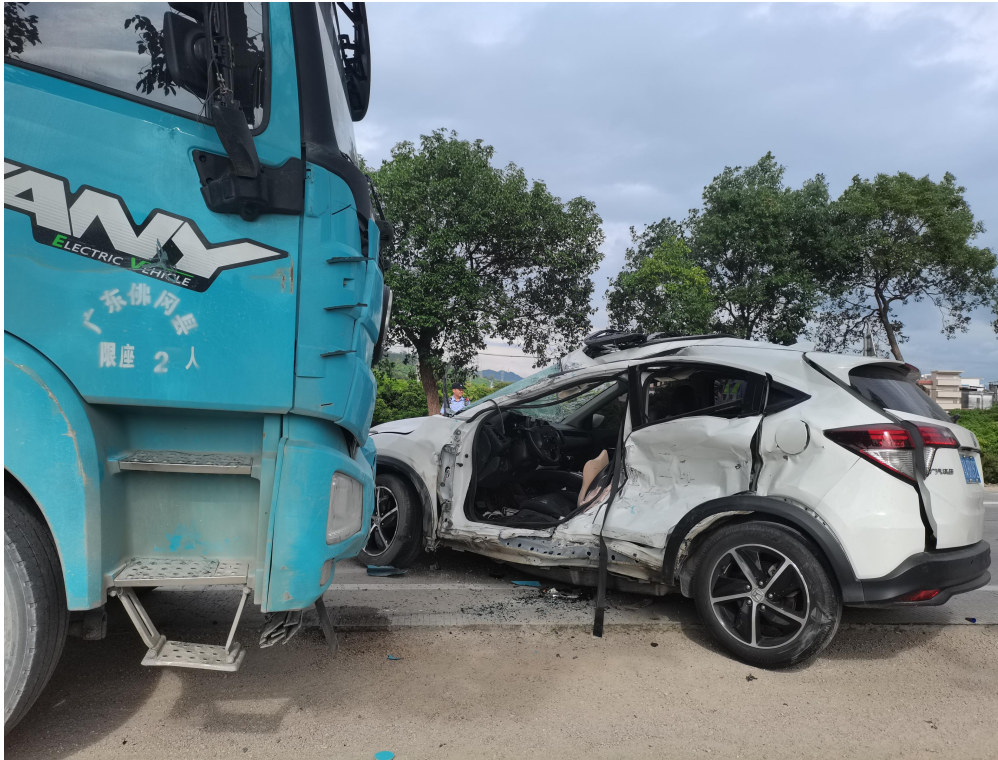
图 4 事故现场照片