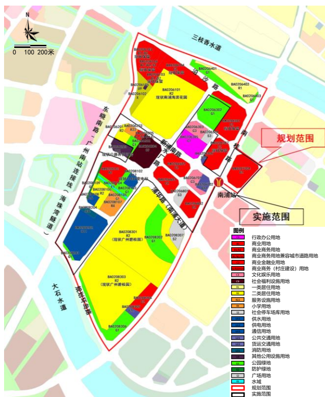
调整前规划示意图