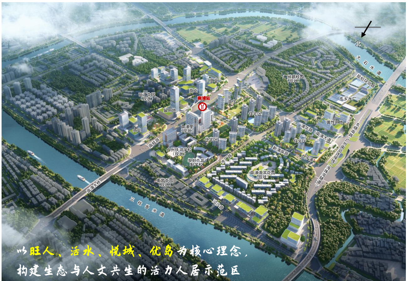
南浦岛东乡片区效果图

南浦岛连接番禺、海珠、荔湾、桂城四区，是承接中心城区服务外溢的重要地区。目前正在推进的东晓南路-广州南站连接线（海珠湾隧道）、天基产业园等项目建设，将为地区发展带来契机。结合南浦东乡片区土地储备工作，开展本次规划调整工作。