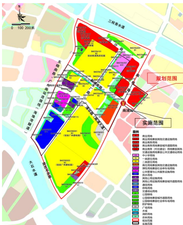
调整后规划示意图