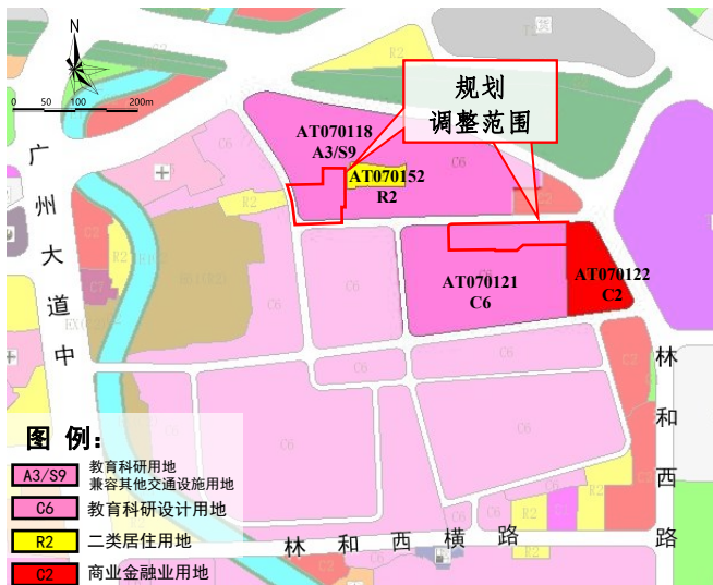
调整前规划示意图