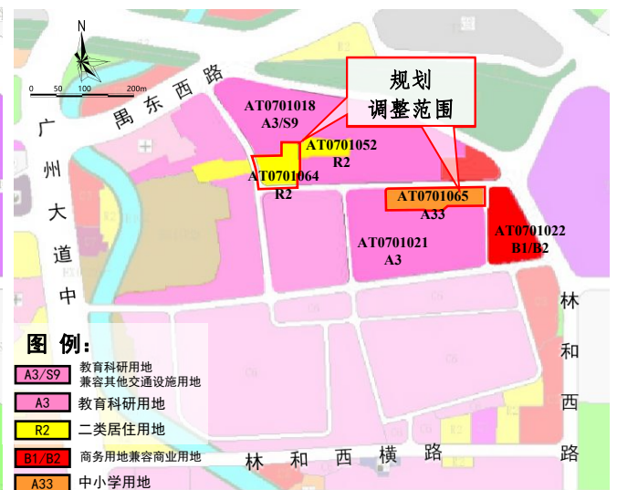
调整后规划示意图